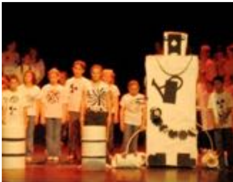
Projet d'atelier autour des machines musicales réalisé en 2006 avec les écoles primaires de Bischwiller (67)

Ces ateliers ludiques et créatifs peuvent également déboucher sur la création d'un véritable spectacle musical.