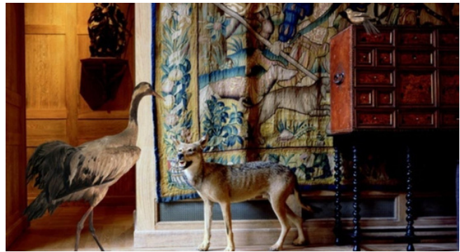
Musée de la chasse, Paris