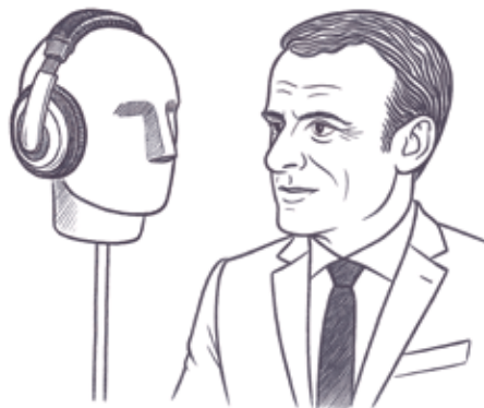
Illustration: Laurane Perrot

Communication et Médiation: Lucile Reynaud